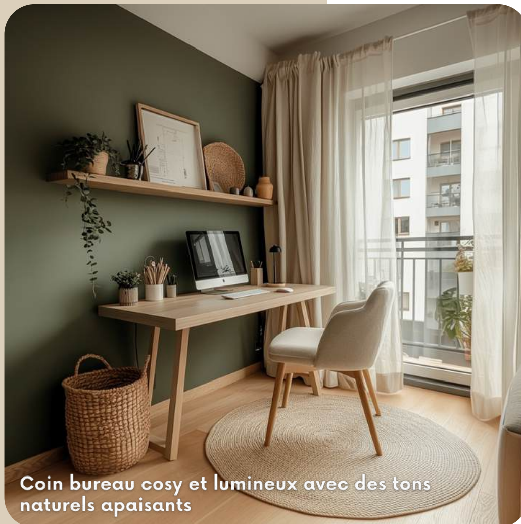
Coin bureau cosy et lumineux avec des tons naturels apaisants

Les touches de beige doux, présentes dans le tapis et le fauteuil, réchauffent l'ensemble, tandis que les accessoires décoratifs en osier et céramique insufflent une atmosphère naturelle et cosy. Avec sa grande ouverture sur l'extérieur et les rideaux légers, cet espace invite à la concentration dans une ambiance sereine et harmonieuse.