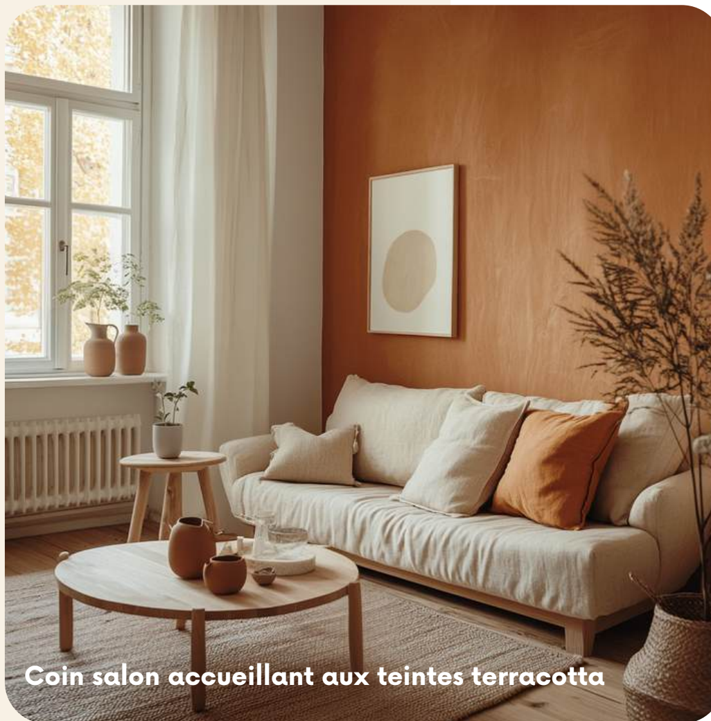
Coin salon accueillant aux teintes terracotta