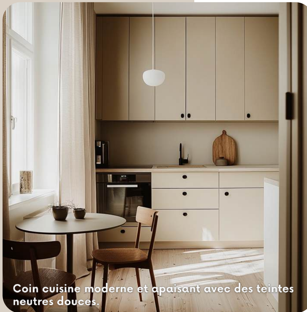
Coin cuisine moderne et apaisant avec des teintes neutres douces.

L'atmosphère épurée est accentuée par l'absence de décoration superflue, laissant place à la pureté des matériaux et à la lumière naturelle.