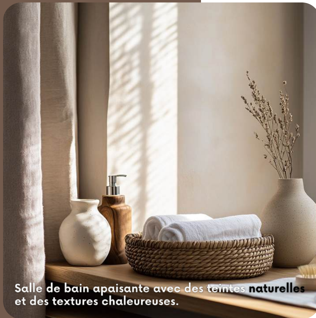
Salle de bain apaisante avec des teintes naturelles et des textures chaleureuses.

Chaque détail est soigneusement choisi pour créer une ambiance épurée sans paraître froide : le bois clair des accessoires, les textiles naturels et les éléments artisanaux en céramique jouent sur la diversité des textures.